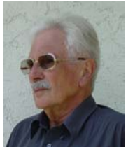
Leopold Huwiler Virtual Graphixx

Audioguides haben sich als Museum- und Städteführer in den letzten Jahren immer mehr verbreitet. Sie ermöglichen eine attraktive Wissensvermittlung und bieten dem Gast geführte Touren, ohne dass man dazu eine Führungsperson braucht. Herkömmliche Technologien (CD-Spieler, Telefonhörer o.ä.) werden dabei immer mehr abgelöst von modernen Geräten wie dem iPod. Die neueste Generation von Kommunikationsgeräten erlauben eine volle Multimedialität (Text, Bilder, Audio, Video) und verfügen über eine GPS-Funktion. Wohin die Entwicklung gehen könnte, zeigt der "Jungfrau Klimaguide", ein Wanderführer auf iPhone, der die heutigen technischen Möglichkeiten zu einer neuartigen Multimedia-Plattform kombiniert.