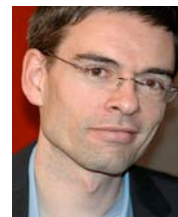
Alexandre Cotting RFID Center

Cette présentation s'intéressera aux évolutions conjointes du eTourisme et des Technologies de l'information. A travers quelques exemples, dont certains issus de l'Institut Informatique de gestion de la HES-SO Valais, nous verrons que le domaine touristique est un domaine d'application privilégié des innovations présentes dans les mondes virtuels.